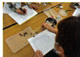
←豆つかみと ボトル巻き上げ↓の様子