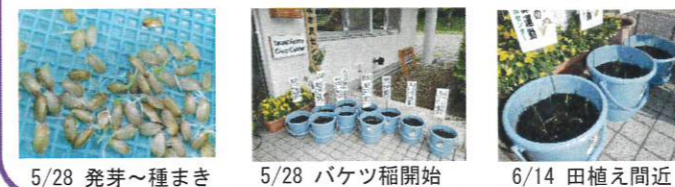
5/28 発芽～種まき 5/28 バケツ稲開始 6/14 田植え間近

「8億人待ちなんだ。悪いが列に並んでくれるか？」ラジオのコマーシャル聞いたことないですか？ほんの少しでも役に立ちたいと奮闘中です。