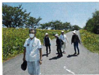
和賀川の堤防沿いを歩きます。