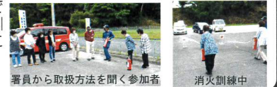
署員から取扱方法を聞く参加者 消火訓練中

6月18日（火）午前10時50分に「給湯室から出火した」という想定で消防訓練（通報訓練、避難訓練、消火訓練）を行いました。消防訓練は年2回行う予定で、次回の消防訓練は12月に行う予定です。